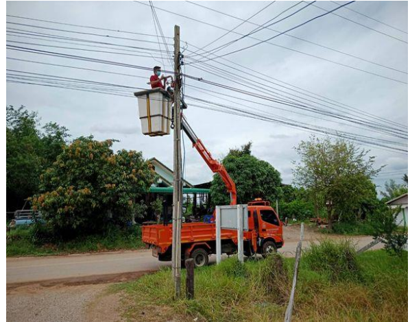
๔. โครงการปรับปรุง ซ่อมแซม ขยายเขตประปาตำบลบุงคล้า